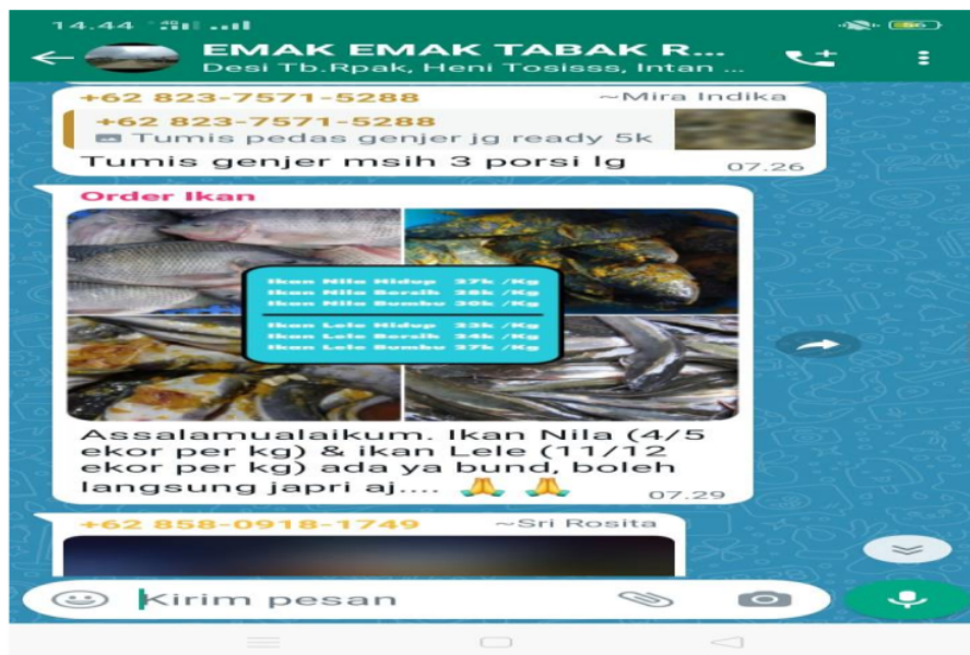
Gambar 4. Jualan ikan

Dari gambar tersebut dapat dilihat proses penawaran, produk ataupun usaha dengan memposting di grup whatsapp. Kemudian para pembeli akan memesan melalui whatsapp pribadi.. Setelah melakukan observasi barulah kemudian melakukan wawancara dengan emak-emak Tabak Rapak ini mengenai alasan mereka membuka usaha tersebut dan dampaknya bagi keluarga Berdasarkan wawancara pada tanggal 20 September 2021, dengan beberapa ibu-ibu yang bertindak sebagai pengusaha kecil rumahan di perumahan Tebak Rapak yaitu ibu Mira Andika selaku penjual