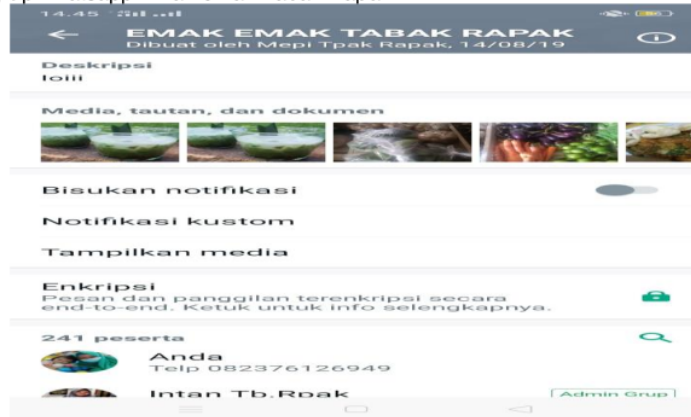
Gambar 1. Grup whatsapp Emak-Emak Tebak Rapak

a. Terbentuk grup whatsapp Emak-emak Tabak Rapak