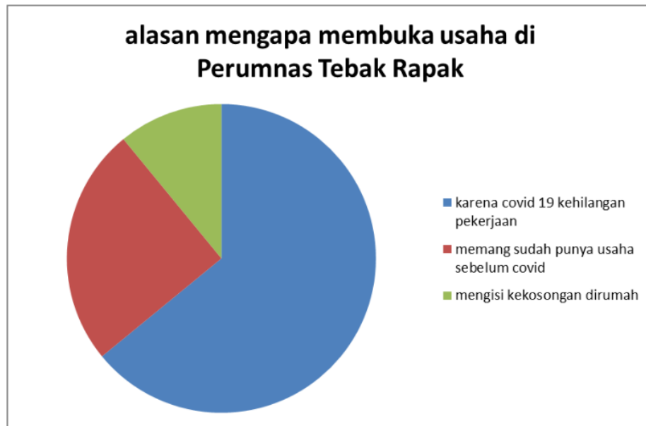
Grafik 1. Alasan mengapa membuka usaha di Perumnas Tebak Rapak

Dalam proses meningkatkan ekonomi keluarga ibu ibu ini berusaha keras agar usaha yang dirintis dari rumah ini bisa memberikan hasil yang maksimal yang bisa menompa keuangan keluarga. Dibalik semua kerepotan sebagai ibu rumah tangga yang kebanyakan dari mereka harus mengurus anak sehingga tidak bisa bekerja diluar rumah justru mendapat jalan untuk tetap menghasilkan uang dari rumah. Dimana ibu-ibu ini tidak perlu jauh-jauh berjualan cukup menunggu orderan dirumah, kemudian melakukan proses cash delivery dari blok 1 ke blok yang lain setiap harinya. Tidak hanya itu dari wawancara tersebut didapatkan hasil bahwa tidak hanya ibu-ibu tapi juga bapak-bapak yang harus kehilangan pekerjaan karena dampak negative covid 19 ini kemudian bangkit membuka usaha sendiri dirumah seperti bapak erin seorang karyawan swasta yang harus work from home (WFH) akhirnya sekarang memutuskan untuk membuat sofa, spring bed dan furniture lain yang penghasilannya jauh besar dari gajinya sebagai karyawan swasta.