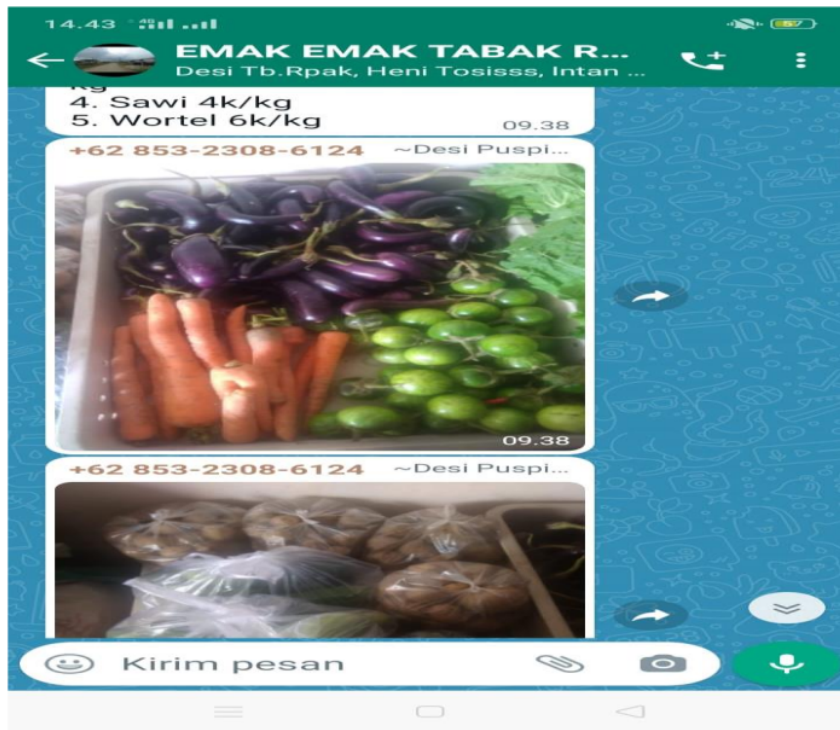
Gambar 2. Jual beli sayur mentah

b. Proses promosi melalui postingan produk di grup