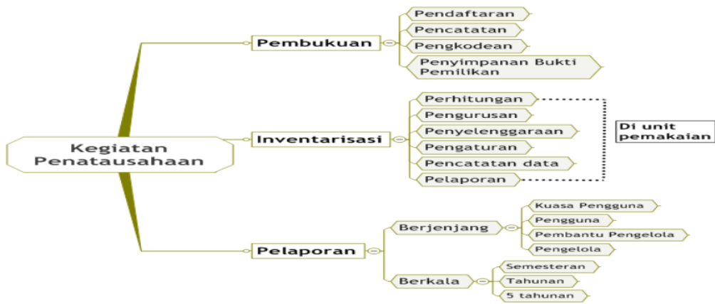
Gambar 2. Skema Kegiatan Penatausahaan Barang