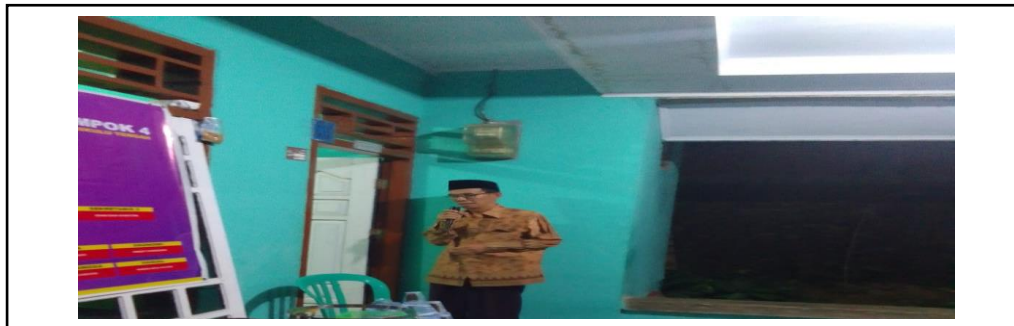
Gambar 3. Pemaparan Materi