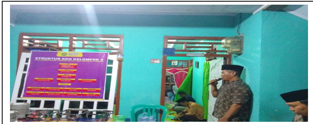
Gambar 2. Kata Sambutan