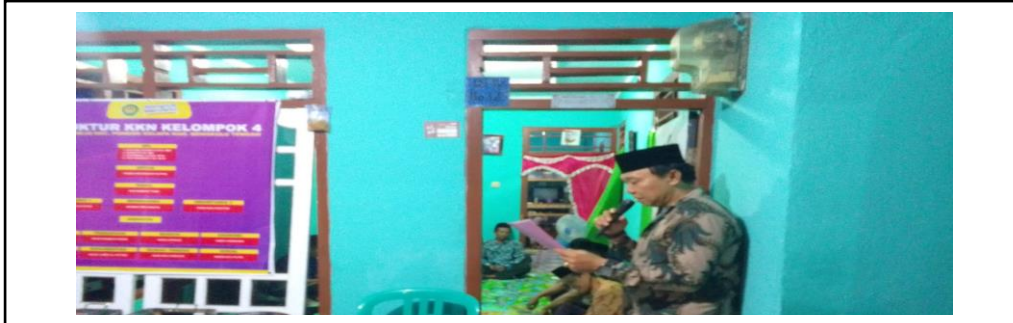
Gambar 6. Penutup