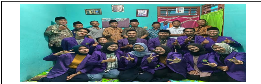
Gambar 7. Foto Bersama