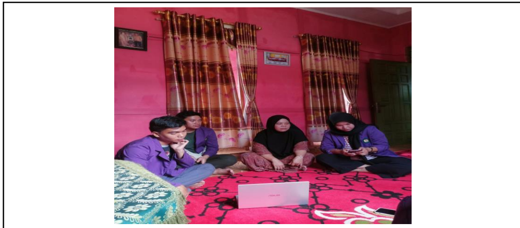
Gambar 4. Penutup foto bersama