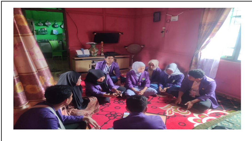
Gambar 1. Pembukaan

Nama Kegiatan : Pelatihan Pembuatan Laporan Keuangan UMKM Menggunakan Microsoft Excel Di Desa Selebar Jaya Kecamatan Amen Kabupaten Lebong Hari, Tanggal : 26 - 30 Maret 2024 Waktu : 08.00- 11.00 WIB Tempat : Rumah-rumah Pelaku UMKM, Desa Selebar Jaya Kecamatan Amen Kabupaten Lebong