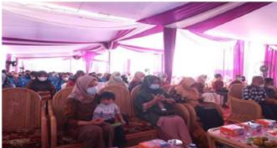
Gambar 6. Setelah penyuluhan, peserta siap dan yakin untuk menanti giliran divaksin, didahului dengan proses doa agar aksi ini berhasil dan menjadi bagian pendukung penanganan wabah.

Adanya role model vaksin berupa kelompok mahasiswa yang berasal dari duta kampus dan dilanjutkan dengan vaksinasi terhadap kurang lebih 100 (seratus) mahasiswa lainnya merupakan aksi persuasif yang memberikan dampak positif pada masyarakat umum yang datang, dimana setelah sesi mahasiswa usai penyuntikan dilanjutkan kepada kelompok masyarakat umum. Sebelum sesi vaksinasi masyarakat umum dilakukan tim penyuluh mengakhiri sesi tanya jawab dengan berdoa bagi keberhasilan penanganan bencana pandemi. Berikut ini doa bersama setelah penyuluhan dan antrian menunggu proses vaksinasi :