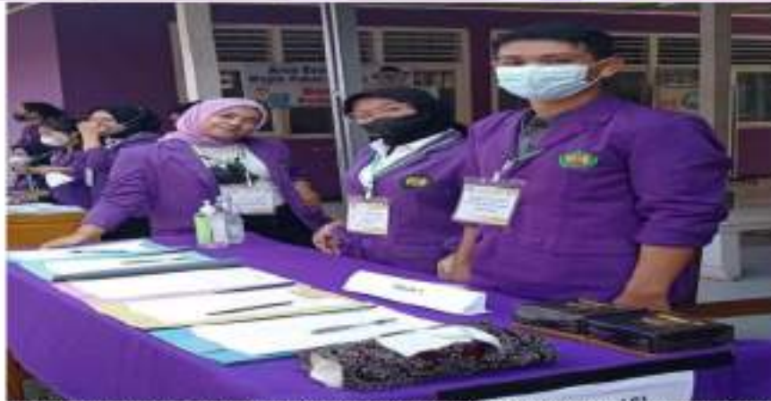
Gambar 3. Proses pendaftaran dan pendataan serta pengelompokkan masyarakat (eksternal) target vaksinasi yang langsung diarahkan ke tempat kegiatan.