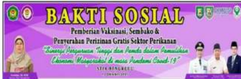
Gambar 1. Banner aksi sosial penyelenggaraan vaksinasi yang melibatkan multistakeholder di provinsi Bengkulu

implementasi kebijakan yang merupakan bagian dari ilmu Kebijakan Publik yang akan atau telah mereka terima. Bagaimana mahasiswa seharusnya berperang menjadi bagian atau role model pelaksanaan kebijakan sehingga menjadi agen pengungkit keberhasilan program ini. Berikut dokumentasi utama kegiatan pengabdian pada masyarakat pada tanggal 12 Oktober 2021 :