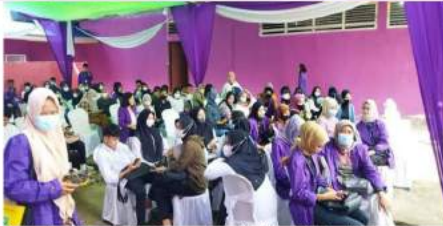
Gambar 7. Kelompok mahasiswa yang telah selesai divaksin, dan dalam proses pemantauan.