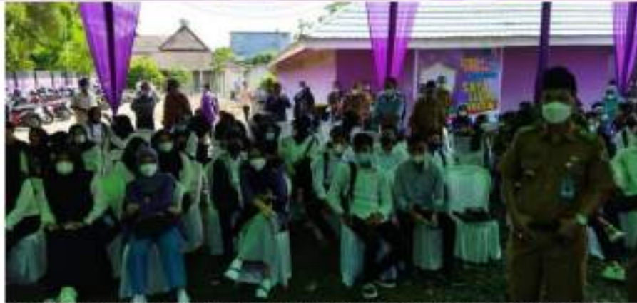
Gambar 9. Masyarakat umum yang selesai divaksin, menunggu reward , dilanjutkan dengan kegiatan pemberian izin gratis sektor perikanan.