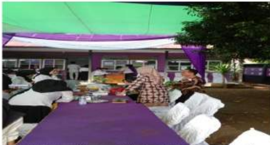
Gambar 8. Proses pendataan pasca vaksin dan pemberian sembako gratis pada masyarakat umum

Vaksinasi tidak menimbulkan efek atau dampak buruk bagi kesehatan, salah satunya dibuktikan dengan tidak adanya keluhan pasca vaksin kecuali mengantuk, dan keram di sekitar tangan pasca injeksi. Masyarakat melihat langsung bagaimana kelompok mahasiswa ini tetap sehat dan antusias menuntaskan kegiatan vaksinasi ini. Klarifikasi dengan melihat langsung kelompok peserta vaksin berhasil meyakinkan masyarakat umum untuk ikut mau menerima suntikan pertamanya di STIA Bengkulu.