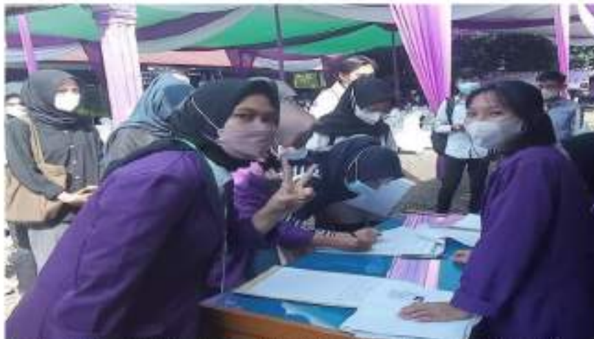
Gambar 4. Proses pendataan mahasiswa (internal) target sasaran vaksin sekaligus role model kegiatan.

Kelompok masyarakat umum pun diberikan penyuluhan dari tim dosen STIA Bengkulu, materi penyuluhan terkait pandemi yang sedang berlangsung tidak hanya mengguncang Indonesia tapi juga dunia. Upaya pemerintah berbagai negara di dunia saat ini adalah menciptakan herd immunity salah satu caranya melalui program vaksinasi, oleh sebab itu semakin cepat program ini mencapai sasaran semakin cepat pula kekebalan komunitas terjadi. Keberhasilan program vaksinasi tidak hanya ditentukan oleh pemerintah tapi juga masyarakat yang kooperatif. Masyarakat juga diedukasi terkait jenis-jenis vaksin mulai dari sinovac, bio farma, Astrazeneca, Sinopharm, moderna, pfizer, Sputnik V, Janssen, dan Convidecia. Vaksin yang digunakan adalah Sinovac. Tenaga kesehatan juga turut andil dalam proses penyuluhan terkait persyaratan agar dapat divaksin dan efek setelah vaksin. Adapula sesi tanya jawab terkait vaksin dimana ini merupakan bagian terpenting yaitu klarifikasi terhadap berbagai isu miring setelah injeksi vaksin sinovac. Berikut ini dokumentasi kegiatan inti yaitu penyuluhan pentingnya vaksinasi :