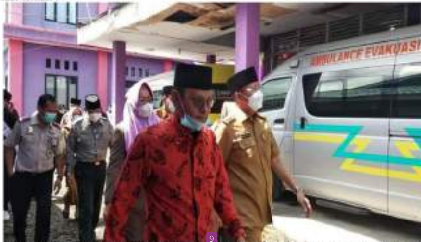
Gambar 2. Kehadiran Multistakeholder dalam kegiatan pengabdian pada masyarakat yang diselenggarakan oleh STIA Bengkulu.

STIA Bengkulu tidak bekerja sendiri dalam melaksanakan kegiatan vaksinasi ini tapi bekerja sama dengan multi stakeholder mulai dari pemerintah provinsi (bahkan dihadiri langsung oleh Gubernur Bengkulu Robidin Mersyah), kepolisian yaitu Polda Bengkulu, Dinas Kesehatan Kota Bengkulu serta petugas vaksin yang berasal dari Kantor Kesehatan Pelabuhan Bengkulu. Pelibatan multistakeholder pada eran New Public Service memang tak terelakkan lagi walaupun keterlibatan ini tidak bisa simetris (Rahaya, 2020). Keterlibatan yang asimetris terjadi pada program vaksinasi, karena multistakeholder penyelenggaraan kegiatan hanya bekerja pada fase implementasi program dan tidak terlibat pada proses perumusan maupun evaluasi program (sesuai dengan peranan masing-masing stakeholder). Pemahaman inilah yang diberikan kepada kelompok mahasiswa baik sebagai target vaksin maupun sebagai bagian dari role model pelaksanaan kegiatan. Berikut dokumentasi kegiatan pembukaan penyelenggaraan pengabdian yang juga dihadiri oleh Gubernur Bengkulu dan berbagai stakeholder terkait :