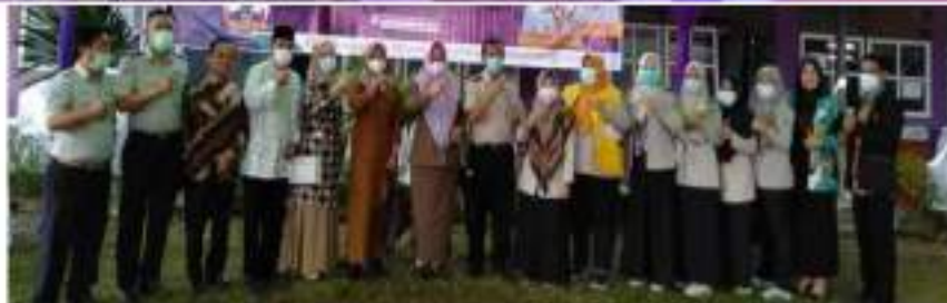
Gambar 4. Multistakeholder selaku tim advokasi implementasi program vaksinasi di provinsi Bengkulu