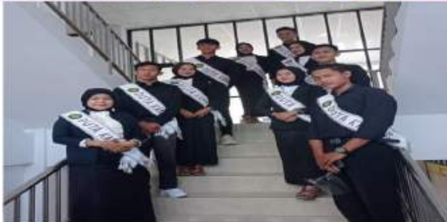
Gambar 5. Duta kampus STIA Bengkulu selaku role model vaksinasi tetap siaga dan sehat walaupun usai menjalani injeksi pertama.