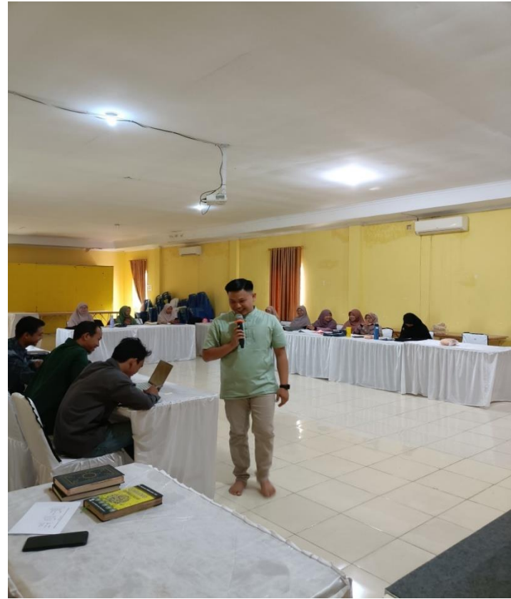
Gambar 2. Kegiatan Pelatihan Kewirausahaan serta Pendampingan pengembangan Ide Bisnis